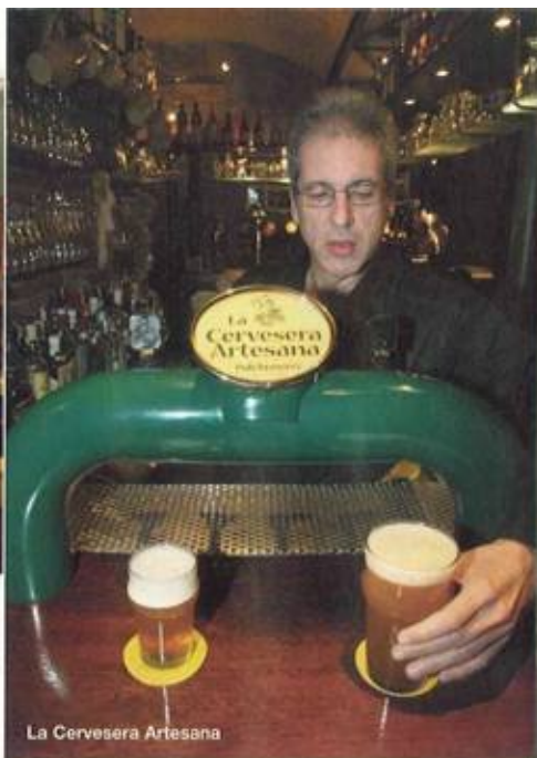
La Cervesera Artesana

Entre les cerveseries adscrites a la tradició belga, cal fer referència al Belchica, un local de l'Eixample regentat per un xicot belga que ofereix una bona varie-