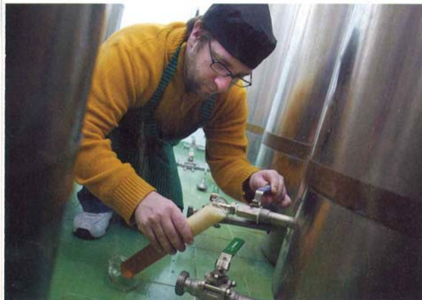
Amb una setmana de fermentació i tres més de maduració, la cervesa artesana està llesta per passar a l'ampolla, on acabarà el procés de fermentació.

"Aigua, malt d'ordi, llúpols i llevats. A una cervesa no li cal res més", així explica Padró el tret diferencial del seu producte